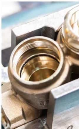
11 - Zamontować uszczelkę O-ring