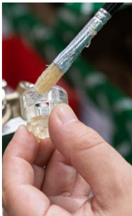
12 - Nasmarować element zamykający