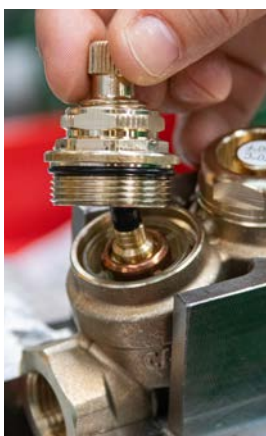
15 - Zamontować wkładkę