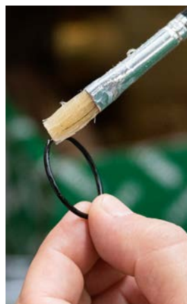
10 - Posmarować nową uszczelkę O-ring