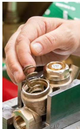
8 - Usunąć sprężynę