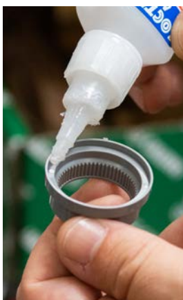
18 - Nałożyć w czterech miejscach kroplę kleju