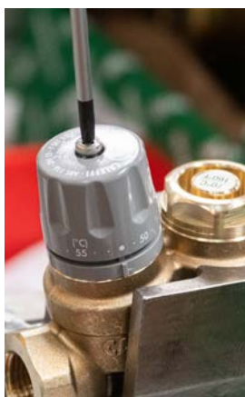
22 - Dokręcić pokrętko. Ustawić wymaganą nastawę