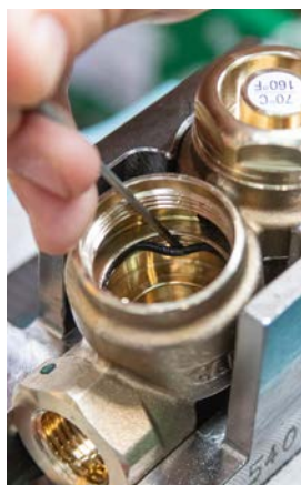
9 - Usunąć uszczelkę O-ring (UWAGA: Usunąć w przypadku stwierdzenia uszkodzenia)