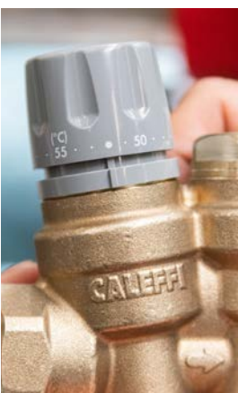
21 - Ustawić nastawę fabryczną