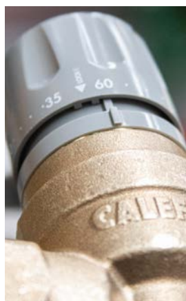
20 - Zamontować ponownie pokrętko. Wskaźnik LOCK musi znajdować się po lewej stronie wskaźnika.