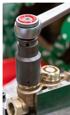
16 - Dokręć śrubę. Siła dokręcania powinna wynosić 15–20 N·m