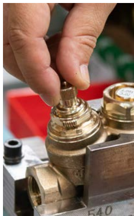
17 - Ustawić zawór w pozycji maksymalnej temperatury