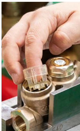
7 - Usunąć element zamykający