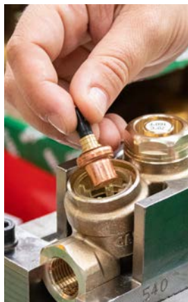
6 - Usunąć czujnik termostatyczny