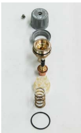
UWAGA - komplet wszystkich elementów