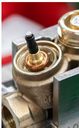
14 - Zamontować elementy w korpusie