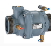
145 serisi dökme demir gövde