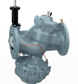
146 serisi dökme demir gövde