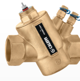
145 serisi pirinç gövde