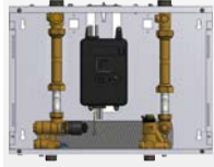
SATK10253 SATK10254 SATK10255