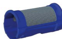
Filtr pierwszego czyszczenia średnica oczka O = 0,30 mm