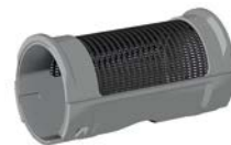
Filtr pracy ciągłej średnica oczka O = 0,80 mm