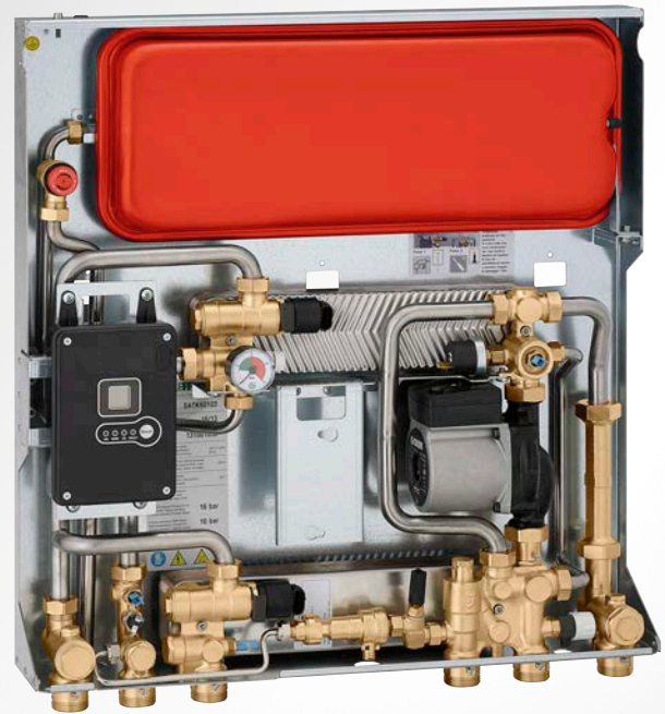
UNTERPUTZVERSION - SERIE SATK60