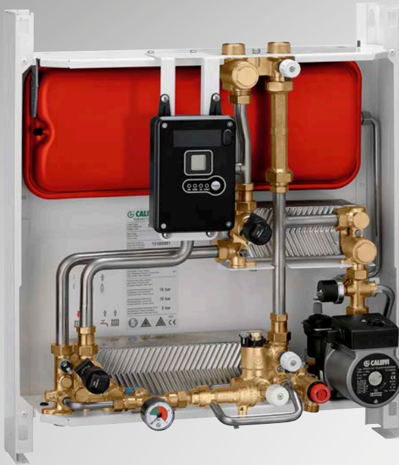
AUFPUTZVERSION - SERIE SATK30