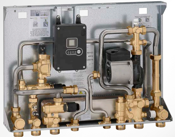
UNTERPUTZVERSION - SERIE SATK50