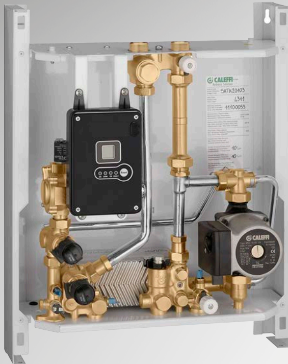
AUFPUTZVERSION - SERIE SATK20