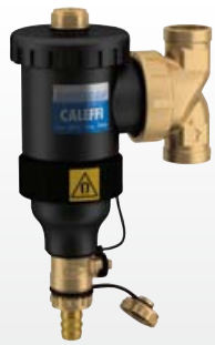
PCT INTERNATIONAL APPLICATION PENDING